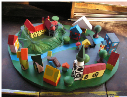
Denní centrum Barevný svět